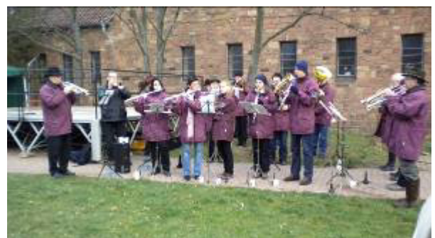
Seit 25 Jahren immer dabei: Das Posaunenensemble Hofheim

Jetzt schon vormerken! Familien- und Stadtteilstift im Nordend am Samstag, 21. Mai 2016, Spielplatz Kleine Weide/Nordendstraße