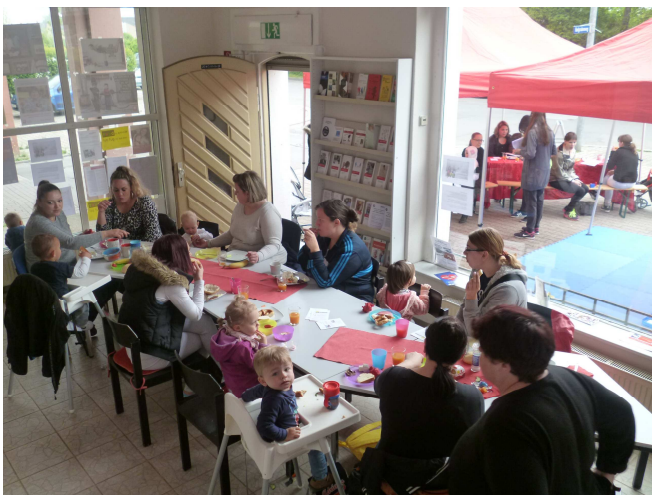
Stadtteilfrühstück im Nordend: Herzlich Willkommen!

Das Stadtteilfrühstück findet monatlich am ersten Donnerstag im Stadtteilbüro Nordend des Caritasverbandes statt.