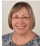
Das Team aus Koordinatorinnen und Seelsorgerinnen